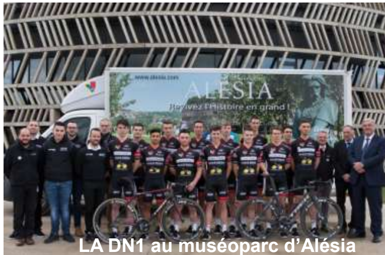
LA DN1 au muséoparc d'Alésia