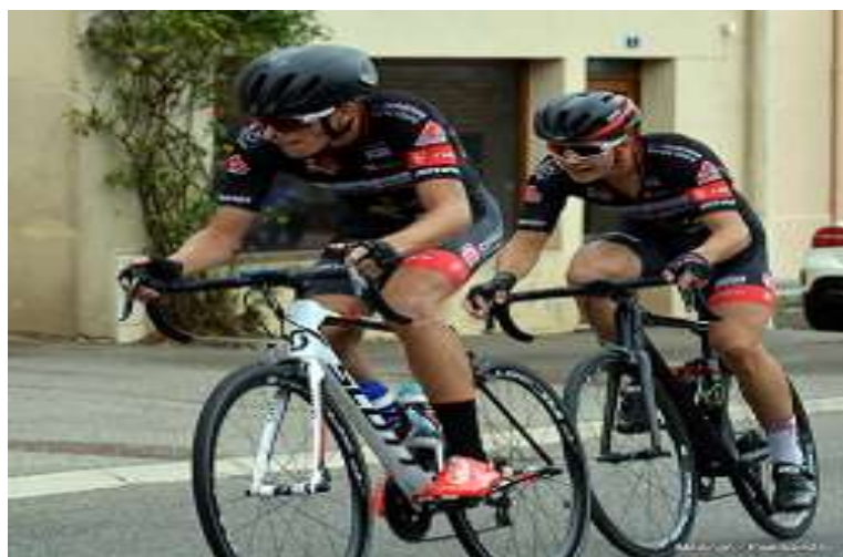
Les cadets à l'honneur