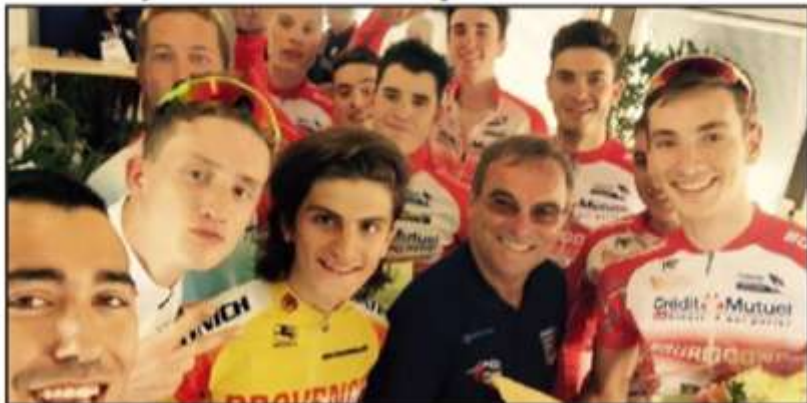
■ La joie des jeunes Dijonnais.

Sélectionnés en équipe de Bourgogne, les juniors du SCO Dijon ont été les grands animateurs de la Classique des Alpes (3 e manche de la coupe de France juniors), samedi, entre Ruy-Montceau (Isère) et La Bridoire (Savoie).