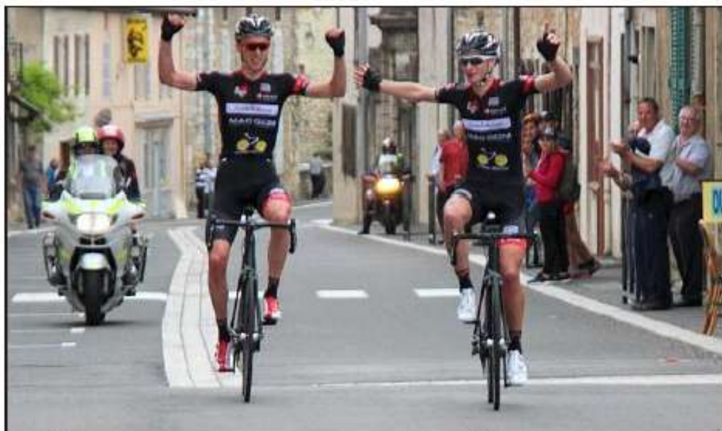
■ Doublé dijonnais hier sur le championnat de Bourgogne Franche-Comté.

Et à la relance ensuite, pour obliger Edouard Lauber, le deuxième homme fort d'Etupes à se dévoiler, Jérémy Cabot monte à son tour au créneau. Pour un